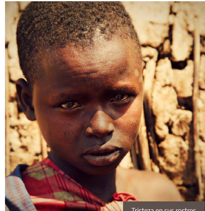
Tristeza en sus rostros