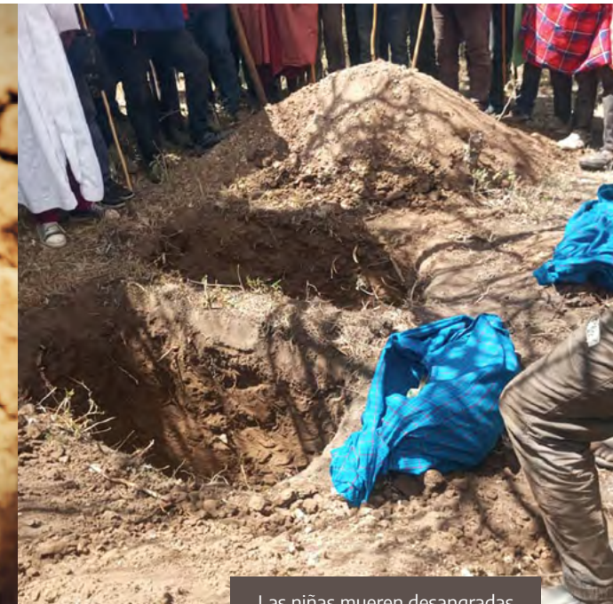
Las niñas mueren desangradas