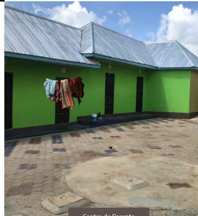
Centro de Rescate

Un cambio esperanzador ha surgido con el proyecto Rescate Masái , en el que líderes cristianos de etnia masái, junto con autoridades civiles y gubernamentales, están desempeñando un papel fundamental en la transformación social.